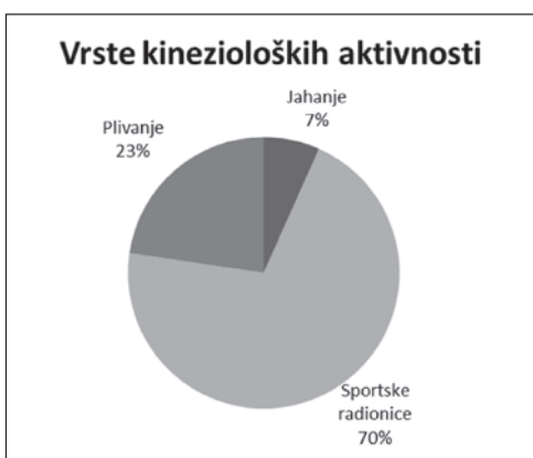
Slika 1. Zastupljenost određenih skupina kinezioloških aktivnosti

Sportske radionice provode kineziolozi – volonteri u skladu sa svojim slobodnim vremenom. Ukoliko kineziolog nije u mogućnosti provesti radionicu, umjesto njih radionicu