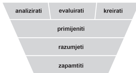
Shema 2. Nivoi učenja u kognitivnoj domeni sukladno Bloomovoj taksonomiji (Anderson et al., 2001).

Izuzev funkcionalne analize neurološke prirode procesa učenja, veoma važno pitanje predstavlja i definiranje hijerarhije ciljeva procesa učenja i podučavanja. Jedna od zasigurno najutjecajnijih teorija klasifikacije edukacijskih ciljeva postavlja američki psiholog Benjamin Samuel Bloom 1956. godine u svojoj knjizi „ Taxonomy of educational objectives: the classification of educational goals “, na čijim će se spoznajama kasnije etablirati opće prihvaćena Bloomova taksonomija.