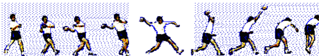
Slika 1. Osnovni udarac (Zvonarek 1999.)

Opis tehnike : Stav igrača je dijagonalan (suprotna noga u odnosu na pucačku ruku je naprijed). Težina tijela je na stražnjoj nozi. Ruka je flektirana u laktu (pod određenim kutom), koji se nalazi u visini ili nešto iznad ramena. Kukovi i gornji dio tijela blago su zaokrenuti prema strani na kojoj se nalazi lopta, a ruka bez lopte nalazi se ispred tijela u visini ili nešto malo ispod visine ramena. Pokret izbačaja počinje poticanjem mišićja stražnjeg skočnog zgloba, pri čemu se maksimalnom brzinom taj impuls prenosi preko koljenog zgloba, zgloba kuka, ramenog zgloba, lakta i šake, a završavaju ga prsti koji konačno izbacuju loptu i daju joj željeni smjer. Navedeni opis tehnike izvođenja osnovnog udarca potrebno je izvesti za ocjenu odličan. S obzirom na težinu odstupanja tj. pogreške od opisanog nastavnik će dodijeliti niže ocjene uvažavajući pogreške na slijedeći način: male (koje ne utječu na narušavanje osnovne strukture kretanja), veće (one zbog kojih se uočljivo odstupa od pravilne tehnike, ali još uvijek bitno ne utječu na promjenu osnovne strukture kretanja) i velike (koje dovode do promjena u osnovnoj strukturi kretanja).