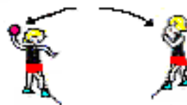
Slika. 3. Hvatanje i dodavanje

Opis: Učenici su podijeljeni u parove međusobno udaljeni 3,5 metara te svaki par ima svoju loptu. Zadatak učenika je napraviti što više točnijih dodavanja